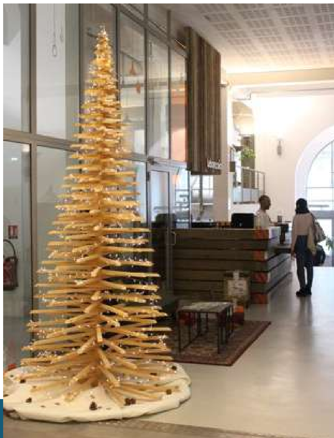
Hall d'entrée 3m