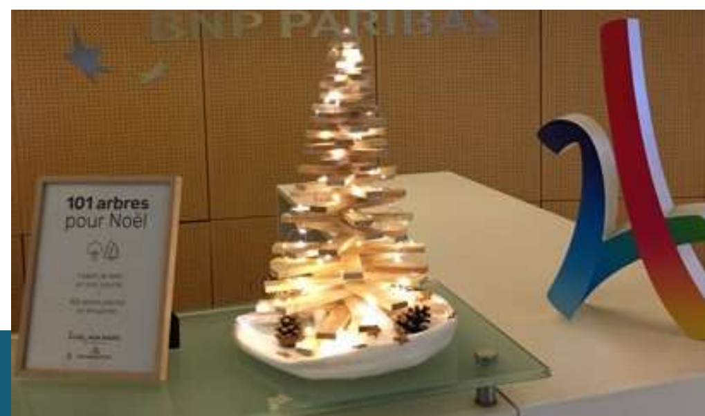
Borne d'accueil 40cm