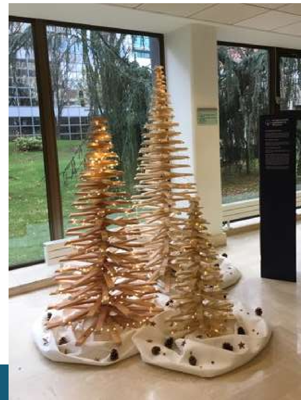
« Mini-forêt » 1m, 1,6m et 2m